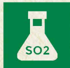
SCHWEFEL- DIOXID & SULPHITE